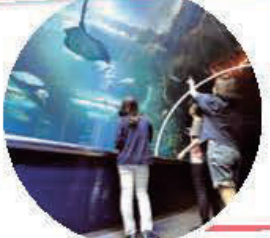
Présentation des espèces marines de la mer du Japon et de leurs environnements respectifs, des eaux peu profondes jusqu'aux fonds marins. Dans le tunnel marin, vous aurez l'impression d'être au beau milieu de la mer !