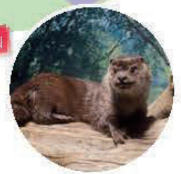
Des castors, des loutres, des phoques de Sibirie et d'autres animaux vivant dans ou proche de l'eau y sont présentés. Qu'ils soient sur la berge ou dans l'eau, vous pouvez les voir s'amuser librement.