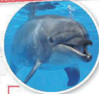
Découvrez, en vous amusant, l'anatomie et les prouesses athlétiques des dauphins grâce aux performances pleines d'énergie des grands dauphins et des dauphins de Cill.