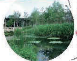
Dunes ou encore rizières, reconstitution de paysages de bord de l'eau de la ville de Niigata.