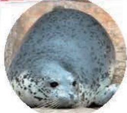
Vous pouvez voir nager des phoques tachetés et des otaries de Steller sous plusieurs angles grâce au tunnel qui traverse l'aquarium. Profitez des explications lors des repas !