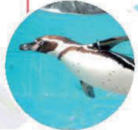
Profitez de la présence de manchots de Humboldt, espèce en danger : regardez-les nager et interagir avec leur partenaire !