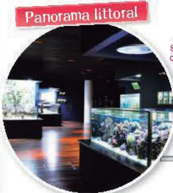
Reconstitution de 7 environnements côtiers dont un récif de corail et un rivage, et présentation des animaux vivants dans ces lieux.