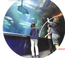
此處分為淺水及深水區域，分別展示棲息在日本海的各種魚類。在海底隧道中能體驗到彷彿置身於海中的奇妙感覺。