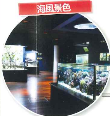
重現珊瑚礁及退潮時的海灘等七種海岸環境，展示棲息於其中之各類生物。