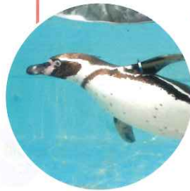
此區展示約70隻可能面臨絕種危機的洪堡企鵝。可以觀察牠們在水中游泳的姿態，或企鵝與母企鵝互相鳴叫的樣子。