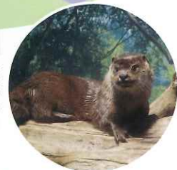
這裡展示河狸、水獺、貝加爾海豹等在水邊生活的動物，不僅可以看到他們在陸地上活動的樣子，也能觀察他們在水裡自由自在活動的樣子。