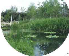
再現了水田、沙丘湖等新潟市的水文環境。