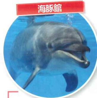
可以觀看充滿動感與活力的海豚表演。在表演中如果被選中，還可以到舞台上近距離觀察海豚。